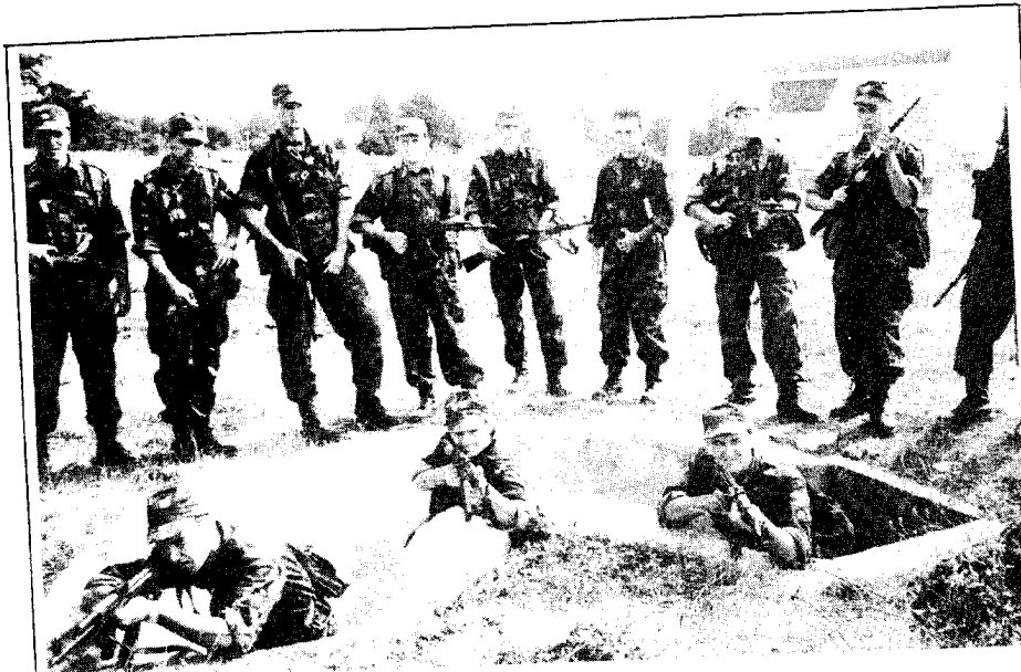
Hrvatski vojnik mora biti vrstan strijelac