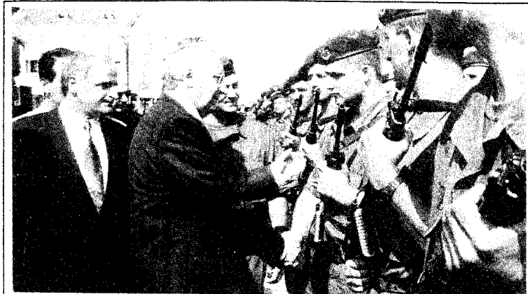
Predsjednik Republike dr. Franjo Tuđman izvršio je smotru postrojbe