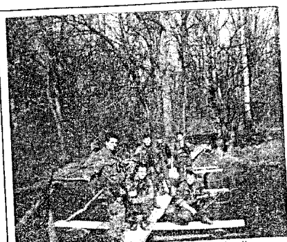
Dio postrojbe na novljanskom bojištu

Jedna od glavnih, koju je zapovjedništvo 153. brigade željelo na ovoj press-konferenciji demantirati je ono o broju poginulih pripadnika. Istina je, da je tijekom svih borbenih akcija smrtno stradalo na pokupskom ratištu 15 boraca, a na slavonskom 27. Ukupno je bilo ranjeno 149 boraca i ranjenima i invalidima u brigadi i dalje brine, a isto tako se dužna pozornost posvećuje obiteljima svih onih koji su kao pripadnici ove postrojbe dali život za slobodu Hrvatske.