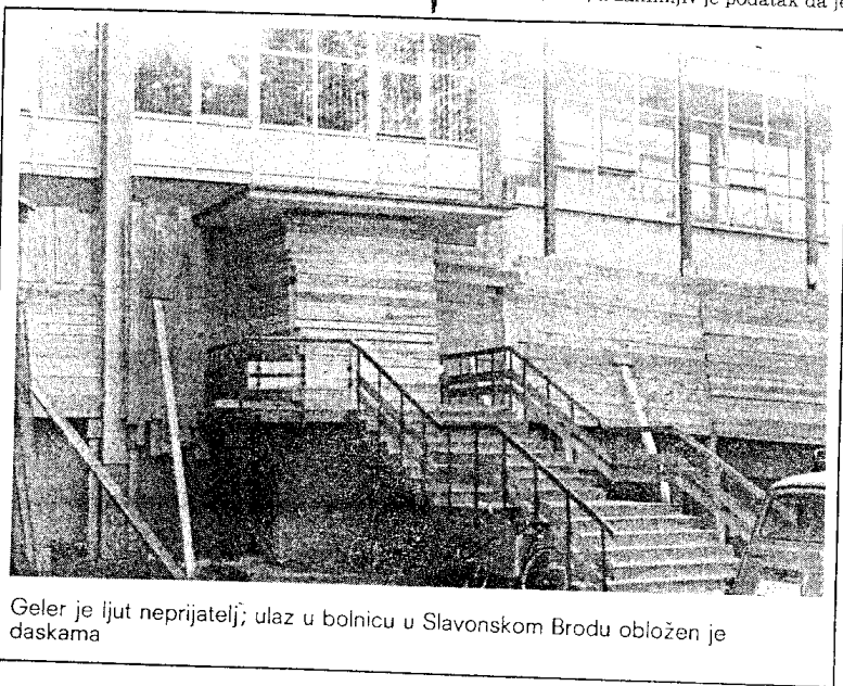
Geler je ljut neprijatelj; ulaz u bolnicu u Slavenskom Brodu obložen je daskama