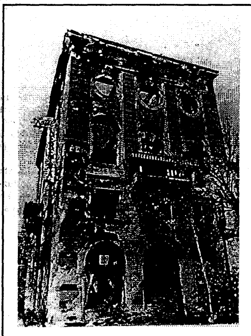
Fot. 4. Hotel "Neretva"