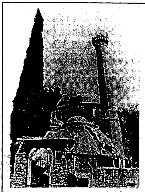
Fot. 2. Karadobegova džamija